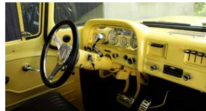
De nya instrumenten kommer från Dolphin medan tilltrattstången hämtades från den skrotade donatorn. Ratten i banjostil kommer från Summit.

Fram monterades droppade spindlar. Sedan kapades även de främre skruvfjädrarna vilket gav en lämplig höjd från marken. Skivbromsar fram kom så att säga på köpet i och med den modernare framvagnen. Även på bakaxeln sitter det numera skivor och ok istället för trummor.