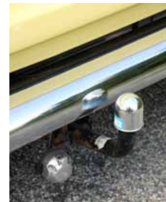
Det finns inte speciellt mycket nytillverkade delar just till denna modell men Klas kunde i alla fall köpa nytillverkade kromade stötfångare till pickupen.