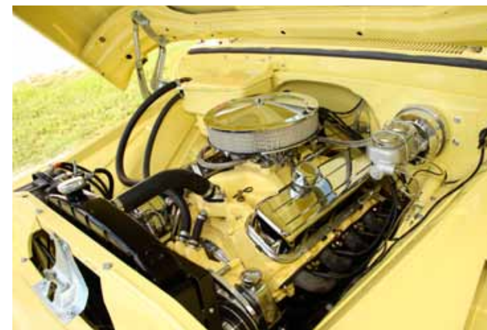
I dag sitter det en lätt trimmad Chevy 454 cui big blockmotor samman med en TH 700 automat i pickupen. Styr- och bromsservo är en blandning av delar från donorsatorpickupen och nya delar.

Även bakaxeln hämtades från "nychassit" men bak behöll Klas originalskruvfjädrar från 1961, men de kapades cirka fyra tum för att få lite lägre look på bygget.